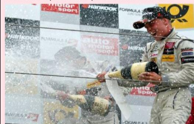
Felix Rosenqvist vann flest lopp i F3 Euro Series förra året.

Felix Rosenqvist satsar på att vinna titeln i EM