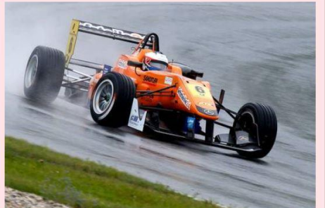
Drömmar om F1 21-åriga Felix Rosenqvist ligger två i EM inför helgens tävlingar. Nu hyllas han av den förre världsmästaren Damon Hill.

Rosenqvist jagar F1: "Ni har en bra förare på gång"