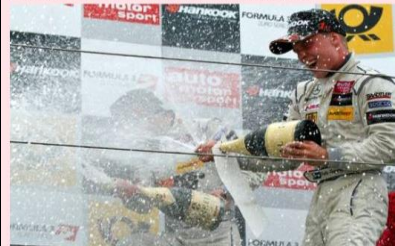
Felix Rosenqvist vann flest lopp i F3 Euro Series förra året.

Felix Rosenqvist satsar på att vinna titlen i EM