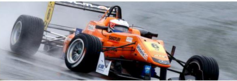
Felix Rosenqvist.