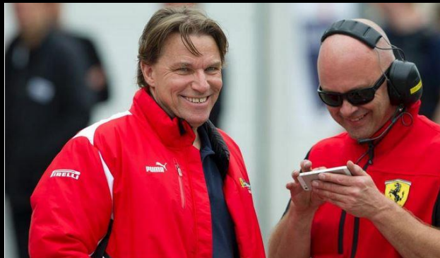
Stefan "Lill-Lövis" Johansson (t v) hyllar Rosenqvist och hans seger under söndagen.

He played the laconic, hard-racing Scandinavian to Raffaele Marcellio's shy, Latin fakeness in the battle for the European F3 title, and only just lost out. Rosenqvist led the Mücke Motorsport challenge and, while on the one hand he benefited from being the Berlin team's only realistic contender at the front, there was the impression that he was fighting a pretty daunting Prema juggernaut. He did it all with good humour, and took a dominant win in the Masters of F3 too at a Zandvoort circuit where he is almost invincible. Fully deserves a crack at the professional levels of the sport.