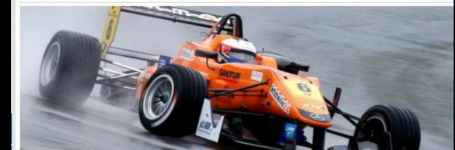
Felix Rosenqvist.